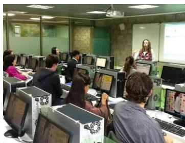
Sesiones de capacitación (Colombia)