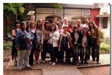
Jornadas de cierre (Uruguay)