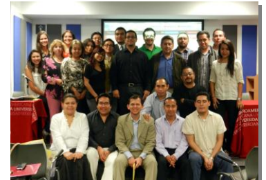
Jornadas de inicio (México - CM)