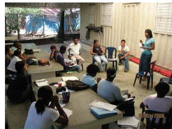
Sesiones de capacitación (Rep. Dominicana)