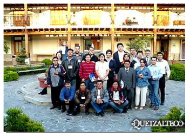
Jornadas de inicio (Guatemala)