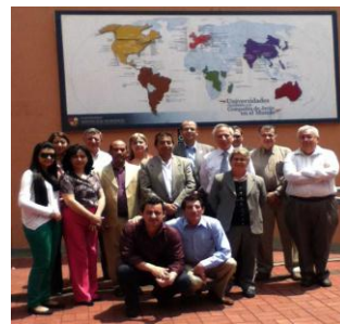
Reunión Anual de Coordinadores del Diplomado